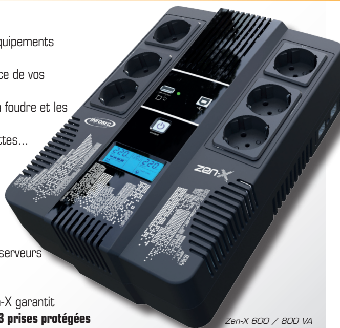
Zen-X 600 / 800 VA